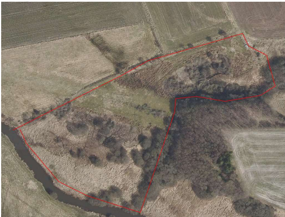
Figur 1. Det er det indrammede areal det drejer sig om. Det lysere grønne midt i ligger højere end resten af arealet, stammer fra en kanal der blev tildækket i 1950'erne.

Arealet ejes af dig, og kan ses på nedenstående luftfoto.